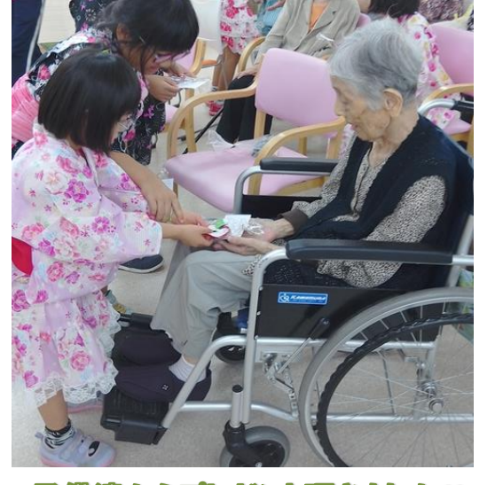
子供達からプレゼント頂きました♡