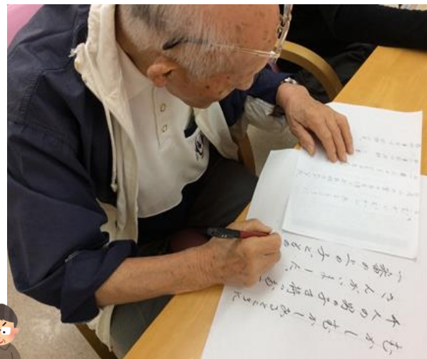
☆紙芝居の脚本中書いてま～す☆