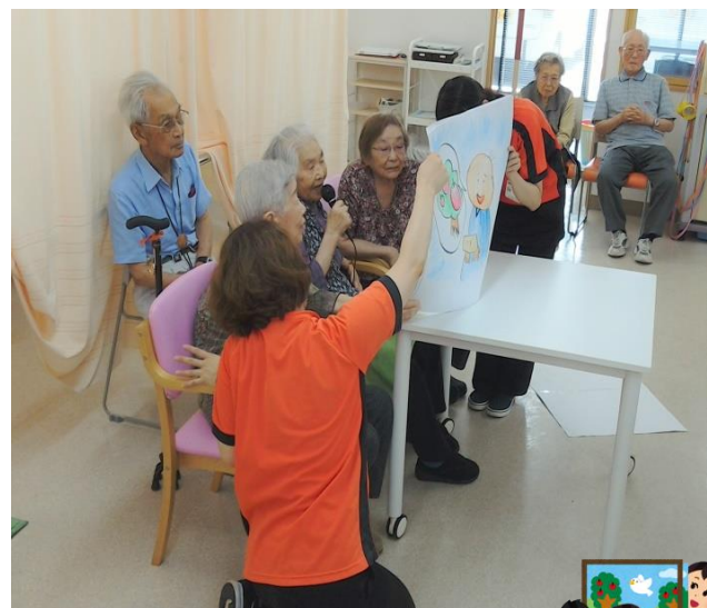
読み聞かせてま～す！(^^)!