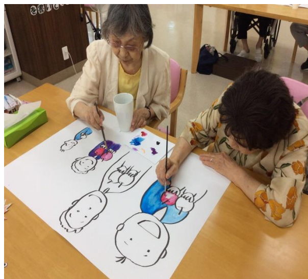
紙芝居に色塗ってます！(^^)!