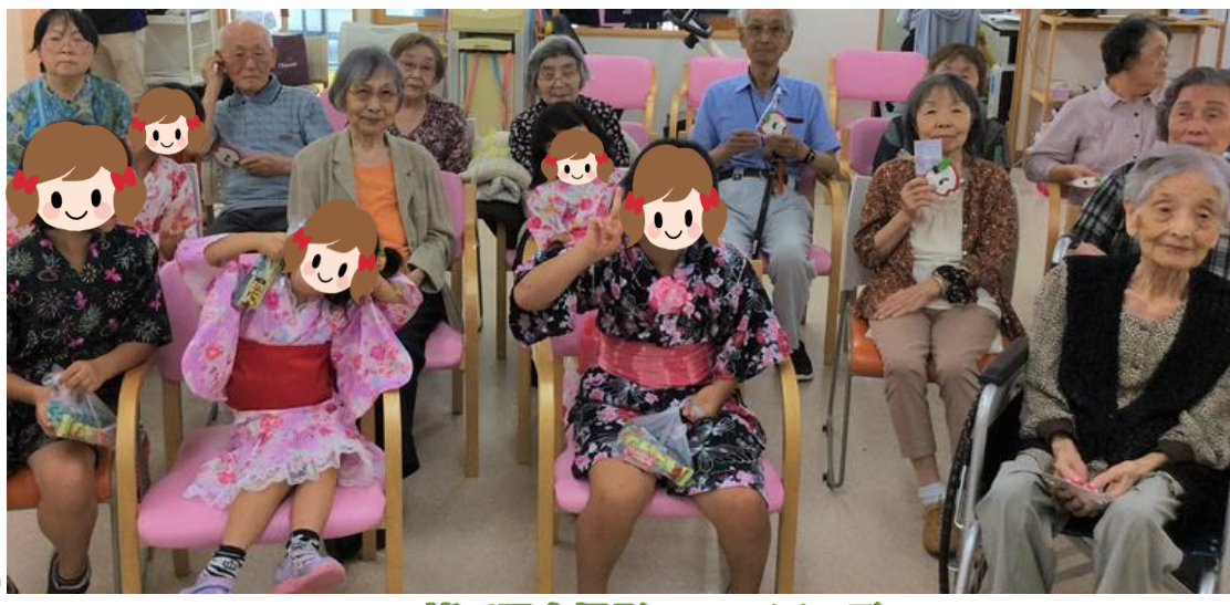
皆で記念撮影📷 ハイチーズ