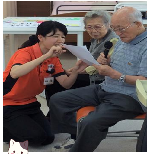
司会してくれてま～す