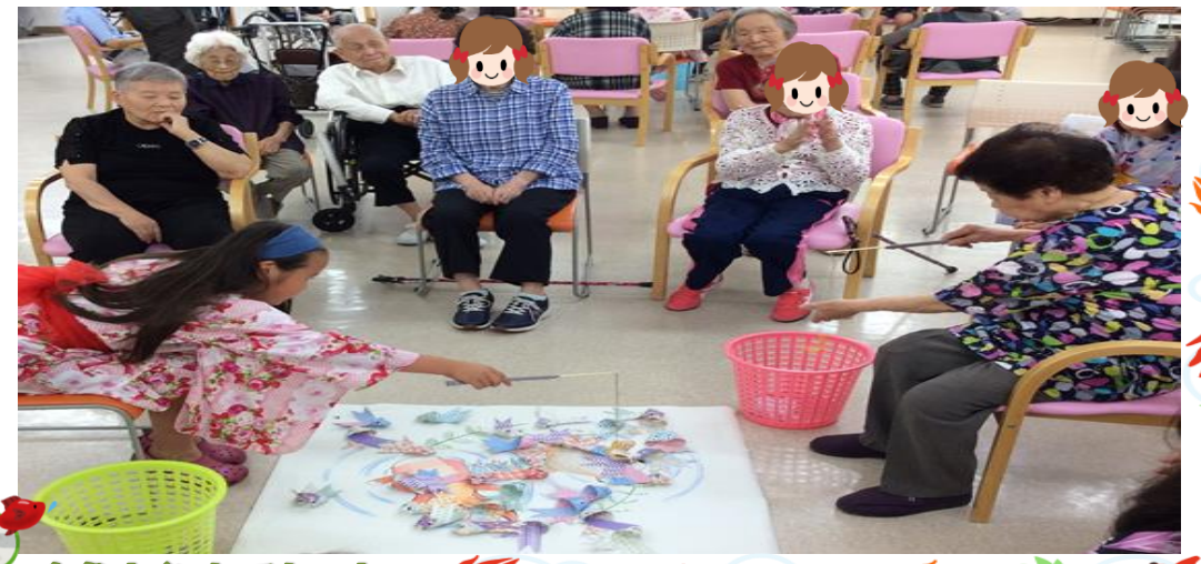
金魚すくいしてま～す